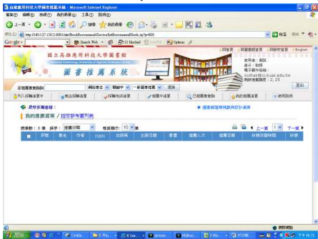
我的推薦清單—指定參考書列表