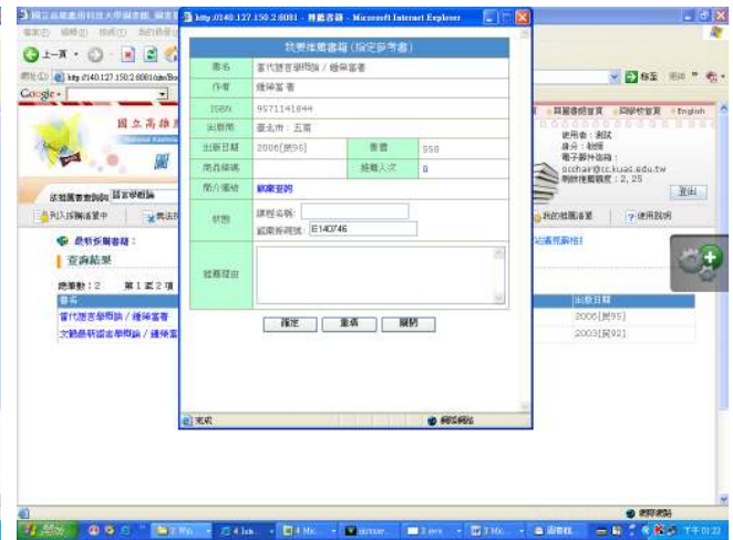
鍵入課程名稱後按確定(不必打推薦理由)