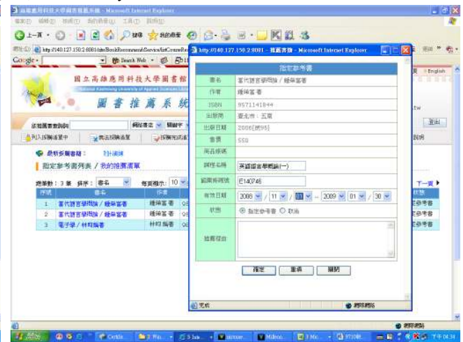
每冊逐一設定有效期限